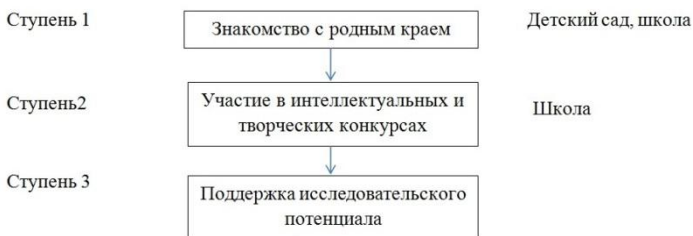
Рисунок 1 – Системный блок «Три ступени»

Введение регионального компонента «родоведение (краеведение)» в курс основного общего образования требует создания новых моделей и механизмов, позволяющих решать вопросы не только краеведческого характера, но и интегрировать их в систему школьного образования. Одной из таких моделей является системный блок «Три ступени», предусматривающий изучение родного края с раннего возраста. На рисунке 1 представлен системный блок «Три ступени».