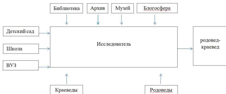
Рисунок 2 – Процесс становления родовед-краеведа